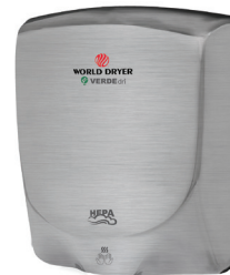
Acier inoxydable, brossé