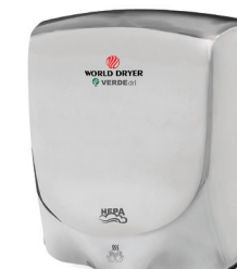
Acier inoxydable, poli